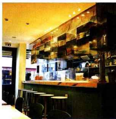
© JEANBRICE LEMAL - LA TAVERNE DE ZHAO - NICOLAI DESPIS